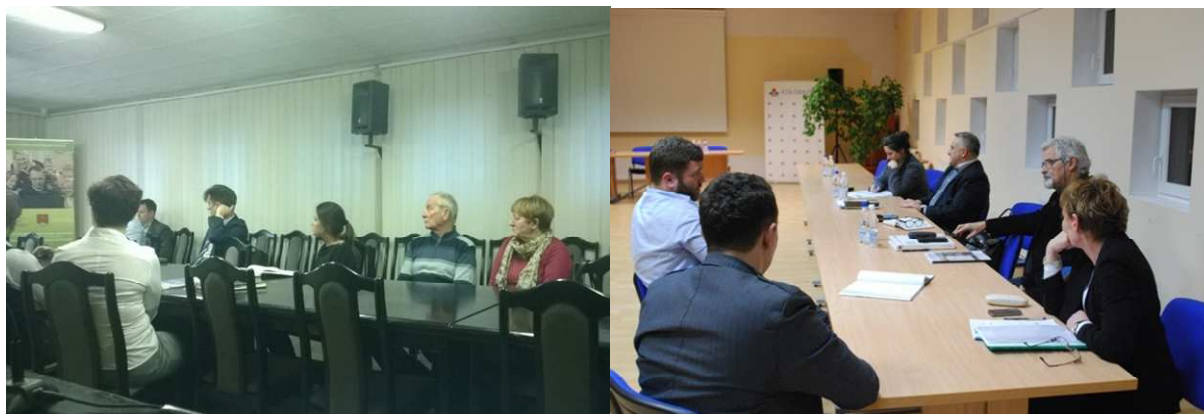
Fot. 5.3 Konsultacje społeczne w Urzędzie Gminy Kołobrzeg (po lewej) oraz w Urzędzie Miasta Kołobrzeg

Projekt współfinansowany jest przez ze środków Unii Europejskiej przyznanych w ramach „Konkursu dotacji na działania wspierające jednostki samorządu terytorialnego w zakresie planowania obszarów funkcjonalnych”