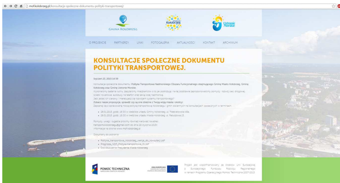
Rysunek 3.2 Informacja na stronie internetowej dotycząca przeprowadzanych konsultacji społecznych

23 lutego 2015r. odbyło się dodatkowe spotkanie konsultacyjne na życzenie Radnych Miasta Kołobrzeg wyłącznie dla Radnych Miasta i Gminy Kołobrzeg oraz Gminy Ustronie Morskie. Wykonawca zaprezentował efekty prac na dokumentem oraz wysłuchał uwag od przybyłych na spotkanie.