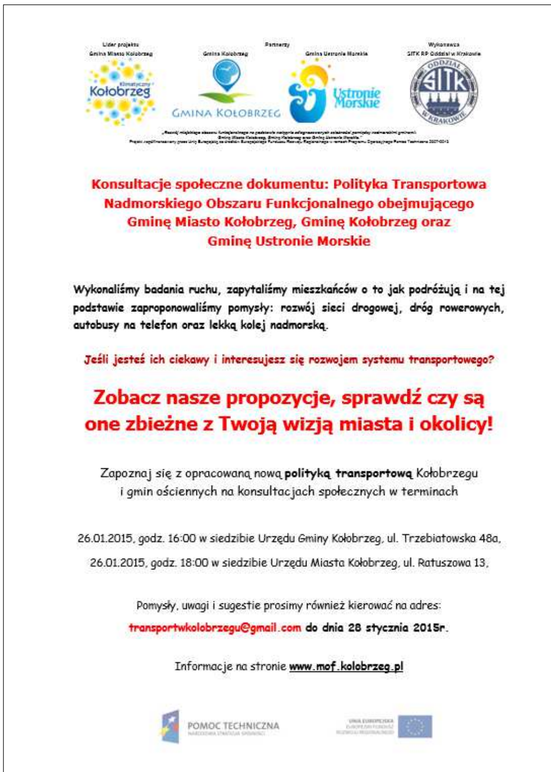
Rysunek 3.1 Plakat informujący o konsultacjach społecznych

Projekt współfinansowany jest przez ze środków Unii Europejskiej przyznanych w ramach „Konkursu dotacji na działania wspierające jednostki samorządu terytorialnego w zakresie planowania obszarów funkcjonalnych”