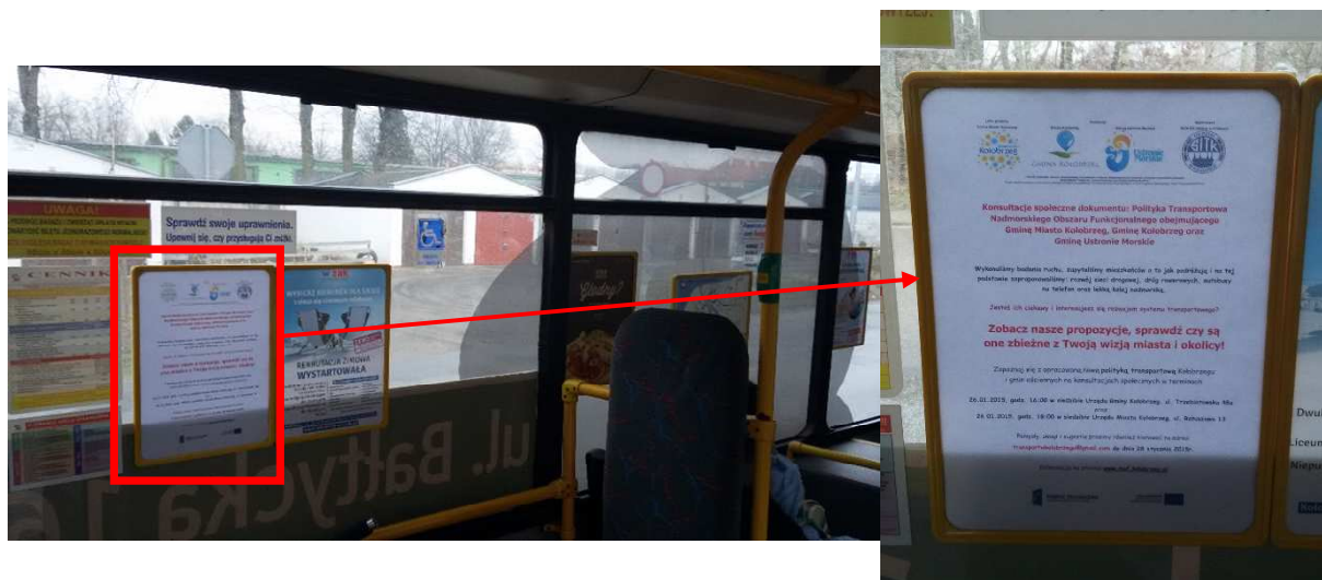
Fot. 5.1 Plakat w autobusach Komunikacji Miejskiej w Kołobrzegu informujący o przeprowadzanych konsultacjach społecznych