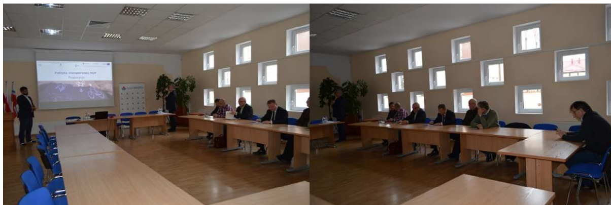
Fot. 5.2 Konsultacje społeczne dla Radnych Miasta Kołobrzeg, Gminy Kołobrzeg oraz Gminy Ustronie Morskie