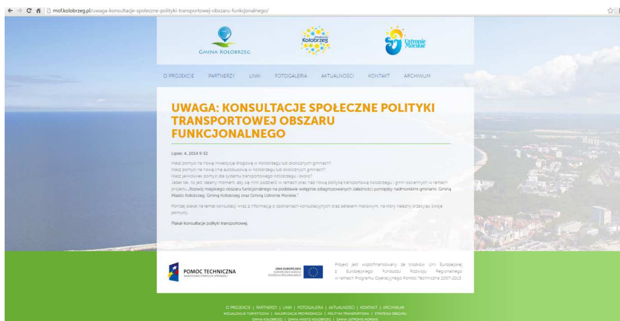
Rysunek 1.1 Informacja na stronie internetowej dotycząca przeprowadzanych konsultacji społecznych

Trzecią uzupełniającą formą było przygotowanie i opublikowanie materiałów o treści jak wyżej, na strony www.mof.kolobrzeg.pl oraz w lokalnej prasie, a także umieszczenie jednostronnych plakatów (format A3) w autobusach w obszarze NOF (przystanki z największą liczbą wymiany pasażerów, główne przystanki w innych miejscowościach) i w tablicach informacyjnych sołtysów w gminach NOF.